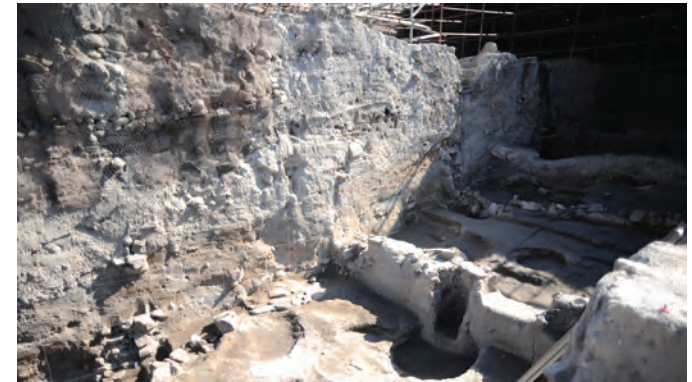
Kaman Kalehöyük'teki kazılar, 2011.