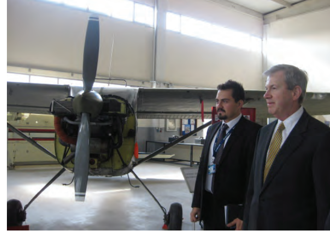
Boeing, İzmir'de Ege Üniversitesi Meslek Yüksekokulu'nda Program Başlattı, 2013.