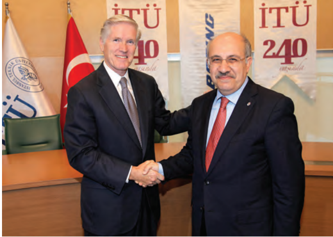
Boeing ve İstanbul Teknik Üniversitesi, Öğrenciler ve Fakülte için Burs Programları Düzenliyor, 2013.