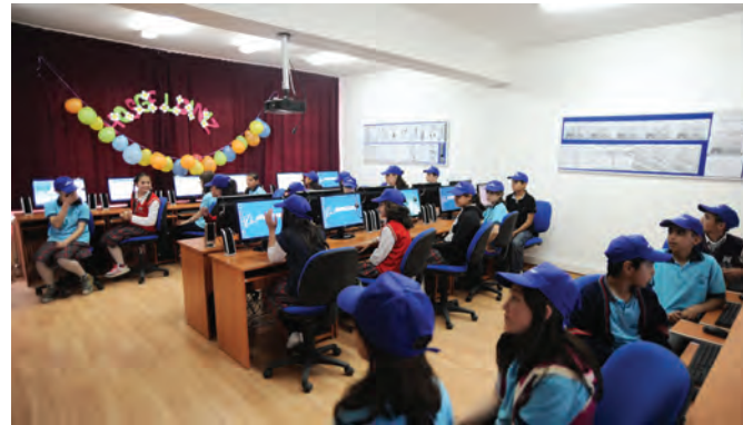
Afyonkarahisar'daki Huriye Aşkar İlköğretim Okulunda kurulan bilgisayar laboratuvarı, 2012.