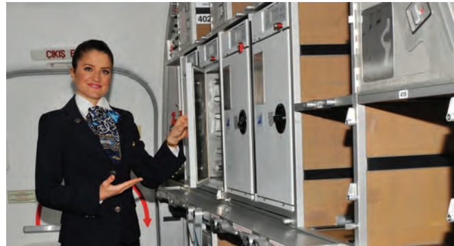
Türk Hava Yolları, mutfağı Turkish Cabin Interiors tarafından üretilen ilk uçağı teslim alırken, 2014.