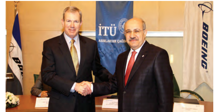
Boeing ve İstanbul Teknik Üniversitesi, Havacılık ve Uzay Teknolojisi Araştırmaları alanında işbirliğine gitti, 2013.