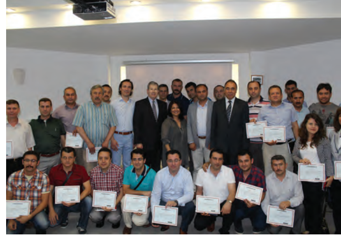
Boeing ve Anadolu Üniversitesi, Uçak Bakım Eğitimi Programının İkinci Evresini Tamamladı, 2014.