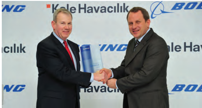
Kale Havacılık, 2012 Boeing Performans Mükemmellik Ödülünü alırken.

* Boeing için yaptırılan Oxford Ekonomi Araştırması, Ağustos 2013.