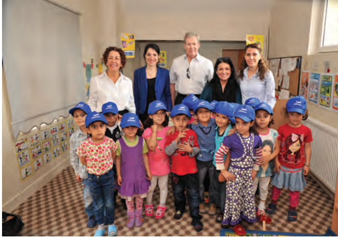
Anne Çocuk Eğitim Vakfı (AÇEV) Alipaşa Aile ve Çocuk Eğitim Merkezi, Diyarbakır, 2014.